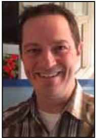
Par Patrick Brouillard Vitro-Services