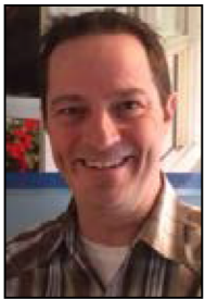
Par Patrick Brouillard Vitro-Services