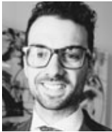
Me Félix B. Lebeau DeBlois Avocats Québec