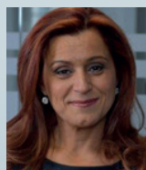
Me Gabrielle Azran Azran & associés avocats inc. Montréal