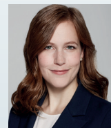
Me Adèle Poirier Langlois avocats, S.E.N.C.R.L. Montréal