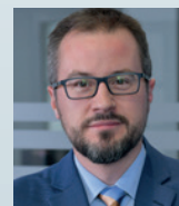
Me Karl De Grandpré Azran & associés avocats inc. Montréal