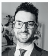
Me Félix B. Lebeau DeBlois Avocats Québec