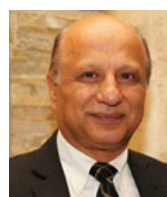
Léo Ziadé Invest Gain Montréal