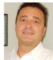
André Grenier Centre d'Inspection du Québec Provincial