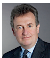
Me Mario Paul-Hus Municonseil Avocats Hypothèques Légales Express Provincial