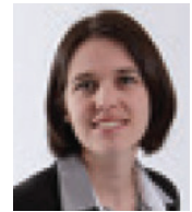
Me France Deschênes KSA Société d'avocats Lévis