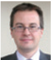
Me Karl De Grandpré Azran & associés avocats inc. Montréal