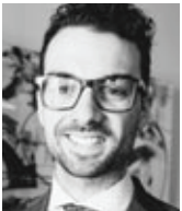
Me Félix B. Lebeau DeBlois Avocats Québec