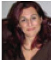
Me Gabrielle Azran Azran & associés avocats inc. Montréal